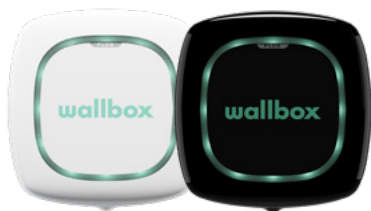
Pulsar Plus Blanco